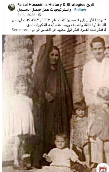
الصورة لأحد القصص الصغيرة من سيرة القائد الراحل فيصل الحسيني

افتتحت المؤسسة، هذا العام، صفحة على الفيس بوك وأخرى على انستجرام، مختصتين بتراث فيصل الحسيني، وتحت عنوان "تاريخ وإستراتيجيات فيصل الحسيني". وبدأت بنشر قصص صغيرة من حياة فيصل الحسيني بهدف نشر تراثه، وتعزيز نشر الرواية الفلسطينية.