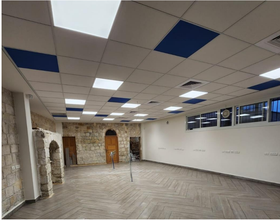
الغرفة في مدرسة الأيتام الثانوية بعد انتهاء أعمال البنية التحتية

2.2 مشروع تطوير حديقة بيئية لمدرسة الاتحاد اللوثري، ومدته 10 أشهر، ما بين 2022/10/4 وحتى 2023/8/6.