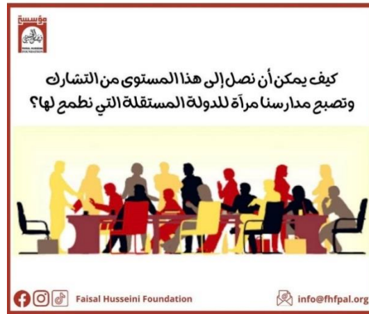
الصورة لأحد منشورات المؤسسة الخاصة بلجان أولياء الأمور

بالإضافة إلى ما ذكر في البند السابق، وفي إطار التعليم القائم على البحث العلمي والتفكير الناقد في بيئات تعليمية ديمقراطية جامعة، حرصت المؤسسة على توعية أكبر عدد ممكن من المهتمين المتابعين لصفحاتها على مواقع التواصل الاجتماعي، فقامت بإنشاء صفحة على فيس بوك بعنوان التعليم القائم على البحث العلمي والتفكير الناقد عذتها بمنشورات تلخص النقاط الهامة، التي وردت في أدلتها التعليمية، في التفكير الناقد، ونظرية الذكاء الثلاثي وتطبيقاتها في اللغة العربية، والتاريخ وغيرها من المنشورات والفيديوهات العادفة لنفس الغرض. كما ركزت المؤسسة عبر صفحاتها العامة على مواقع التواصل الاجتماعي على دور أولياء الأمور الفعال في المدارس، وكيفية تطوير دساتير مدرسية تشاركية، يسهم فيها أولياء الأمور، وذلك بالتزامن مع عمل المؤسسة الداعم لتوجهات أولياء الأمور في حماية الهوية الفلسطينية في المدارس. هذا بالإضافة للمنشورات والفيديوهات الخاصة بالتوعية بمخاطر استخدام منهاج الاحتلال، أو نسخة المنهاج الفلسطيني التي زورها الاحتلال. كما عملت المؤسسة على تطوير فيلمين، أحدهما خاص بفكرة اشتر/ي زمنا في القدس، والآخر خاص بحملة اشتر/ي زمنا لمدارس القدس.