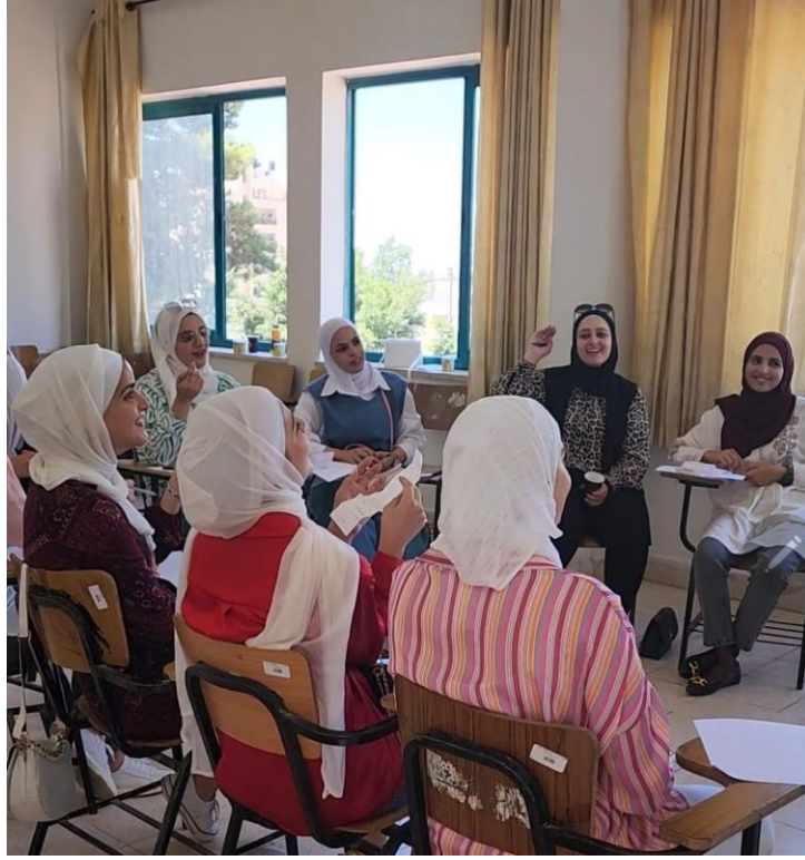
الصورة من تدريب طالبات من جامعة النجاح في مجال تطبيقات نظرية الذكاء الثلاثي في الصف