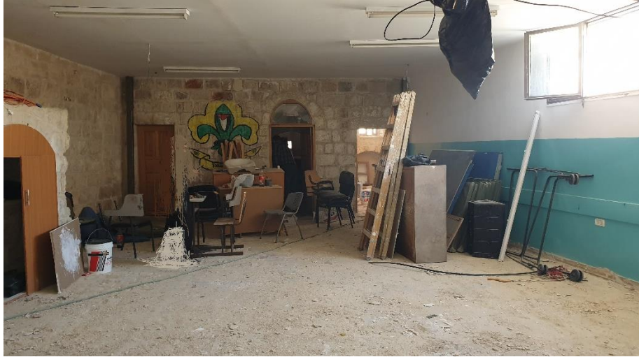
غرفة في مدرسة الأيتام الثانوية قبل بدء الأعمال لتحويلها لمختبر تكنولوجيا

بلغت موازنة المشروع 114,520 دولاراً، بتمويل من مؤسسة الصندوق العربي للإنماء الاقتصادي والاجتماعي عبر منحة بإشراف مؤسسة التعاون.