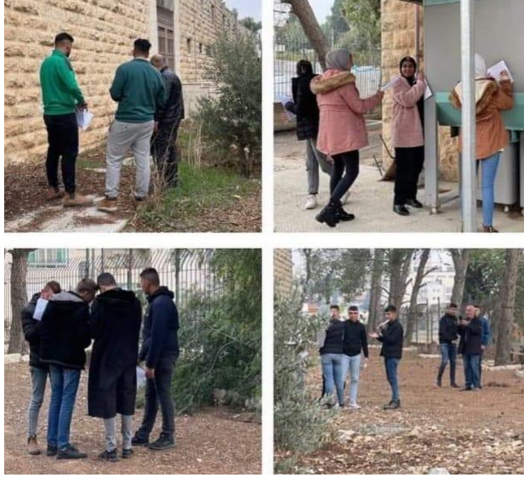
الصور خلال تطوير المعلمون والطلبة للأفكار الخاصة بإنشاء الحديقة البيئية في مدرسة الاتحاد اللوثري

2.3 مشروع دعم وتحديث البنية التحتية لمدارس القدس، الممول من الصندوق العربي للإنماء الاقتصادي والاجتماعي 2، والمنفذ ما بين أيلول 2022 وحتى آب 2023.