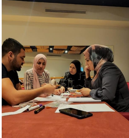
الصور خلال تدريب في البحث العلمي في العلوم الطبيعية لمعلمات ومعلمين من القدس